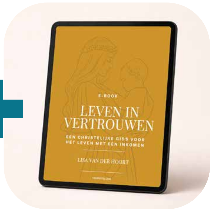
E-book Leven in vertrouwen