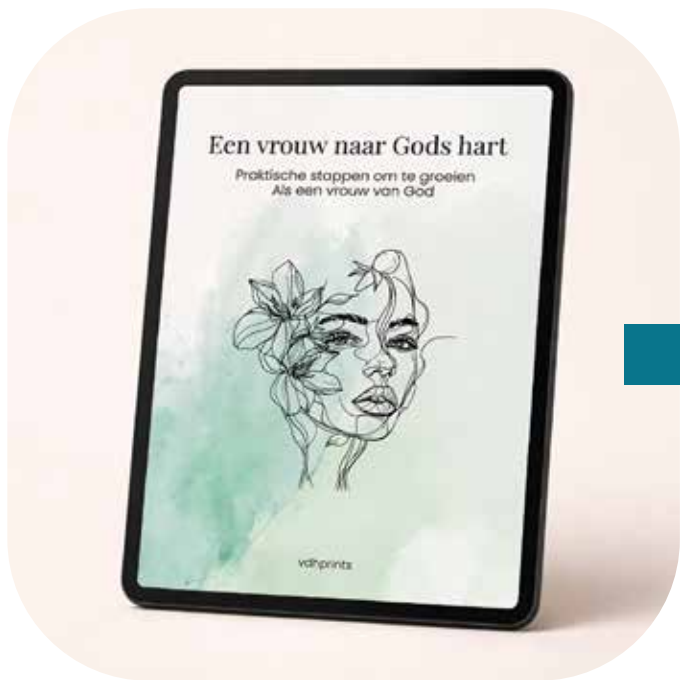
E-book Een vrouw naar Gods hart